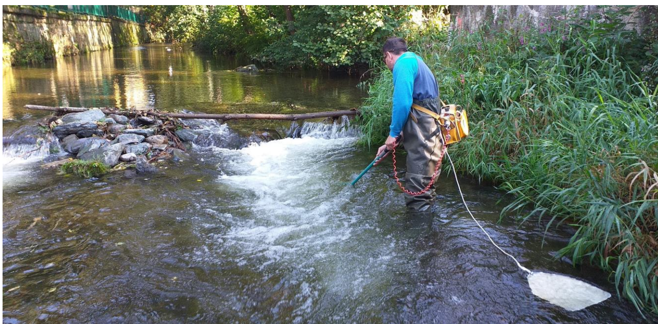
odlov živočichů bateriovým agregátem